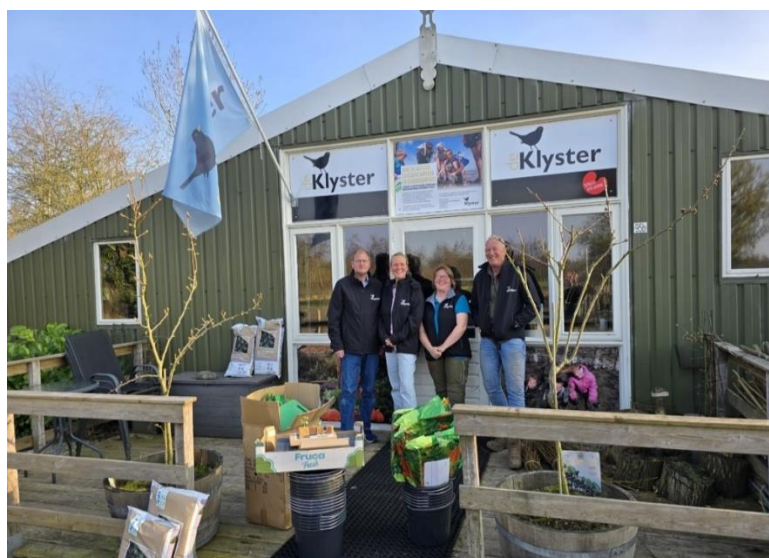
Moestuincoaches begeleiden 20 weken leerlingen in de moestuin

Het vroege voorjaar 2025 gingen voor het eerst 3 moestuincoaches en 1 moestuinadviseur van start om het onderwijs te begeleiden bij het opzetten van een moestuin. Deze 4 klystermedewerkers behaalden het jaar daarvoor hun moestuincoachcertificaat. De Klyster ontving voor haar moestuinprogramma landelijke kwaliteitscertificering.