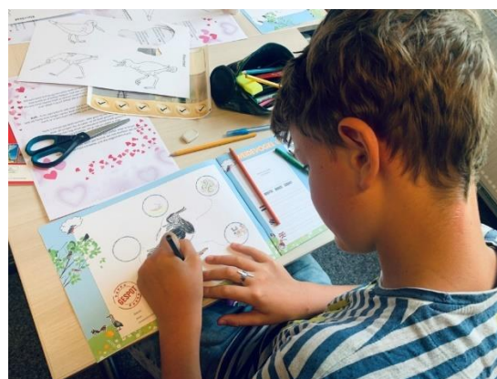
Weidevogelproject Klyster in de pers