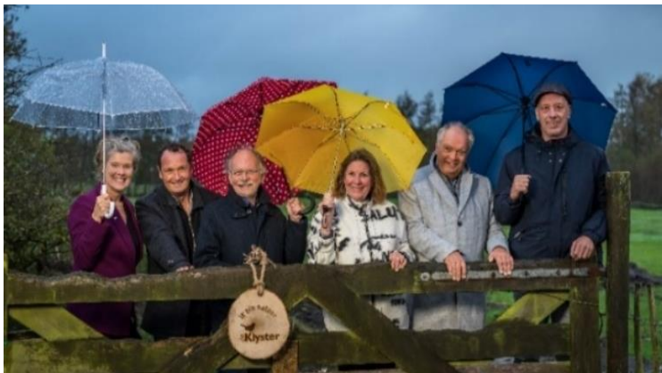
Bestuur Freonen fan De Klyster