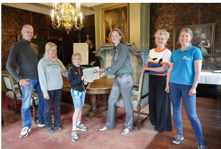
Persfoto 2025: Leerlingen adviseren gemeente over salamanders

De Klyster succesvol gemeentelijk instrument ingezet voor doelstellingen en ambities op het gebied van duurzaamheid, groen en gezondheid.