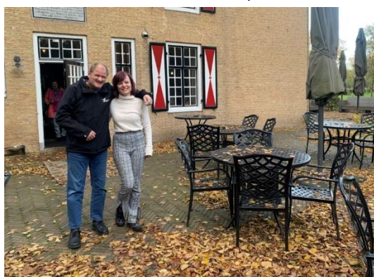
Educatie safari voor NME-ers in noord Nederland