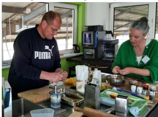
Klysters behalen certificaat Koken in de klas

In 2025 hebben 2 teamleden de cursus koken in de klas gevolgd. Verder werden 4 symposia gevolgd: GDO Kennisdag, GDO-tweedaagse, Aftrap Sûn en Lekker ite, Educatiesafari door de NME-professionals.