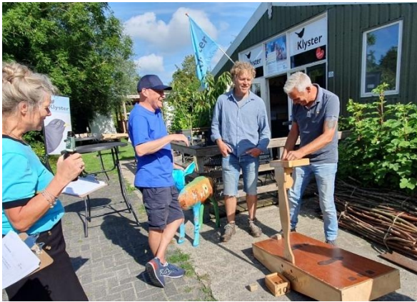
Teamuitje Oud Hollandse Spelen

In 2025 werden twee teamuitjes georganiseerd. Tijdens de uitjes was er volop gelegenheid om elkaar te zien en te spreken. Tijdens de uitjes werd kennis gedeeld over de nieuwste ontwikkelingen in NME-land. Op 9 juli 2025 werd een teamuitje georganiseerd bij De Klyster. Het stond in het teken van Oud Hollandse Spelen en na afloop was er een ouderwets patatje met voor iedereen.