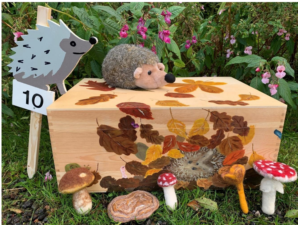
Nieuwe leskist over de Herfst voor groep 1 t/m 4.

Verder werden er 3 lesbrieven gemoderniseerd en opnieuw vorm gegeven.