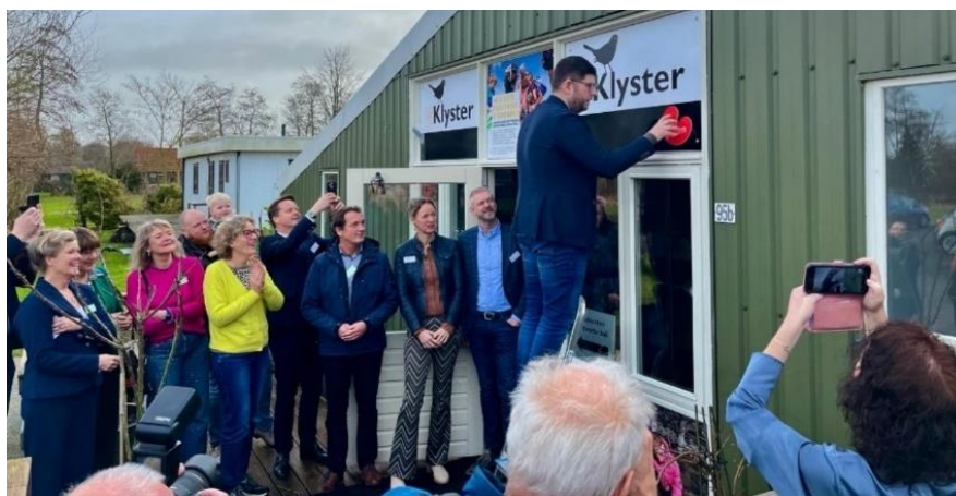
De Klyster waard yn 2024 it earste twatalige NME-sintrum fan Fryslân. Iepene troch deputearre Sybe Knol

Ek yn 2025 hat De Klyster wurke oan twataligens. Skoallen koene NME en Frysk koppelje en de nijsuteringen wiene twatalich lykas de webside en it útjaan fan nij edukatyf materiaal. Dit wie it twadde ûnderfiningsjier foar ús twatalich NME-sintrum. Kontinuearjen koste € 5.300. Dit soarge foar in oerskrieding fan it NME-budzjet.