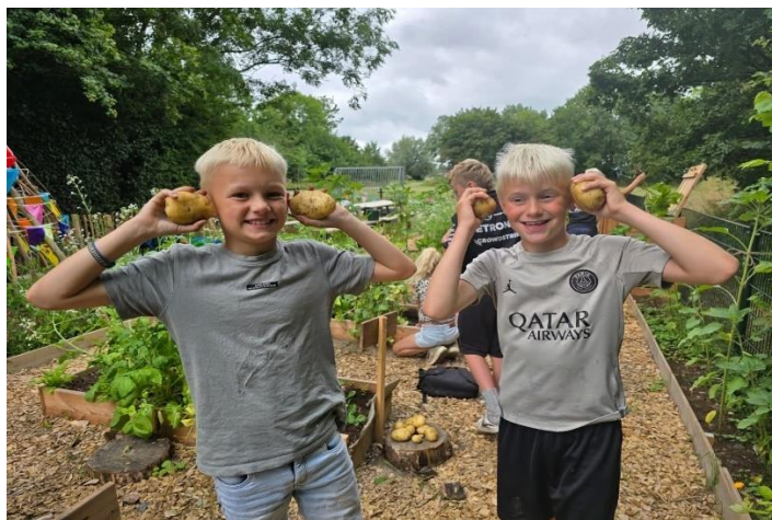
Moestuïneren onder leiding van de klyster moestuincoaches.

Het aanbod werd gecommuniceerd via website, nieuwsbrief, posters, activiteitenboekje, social media.